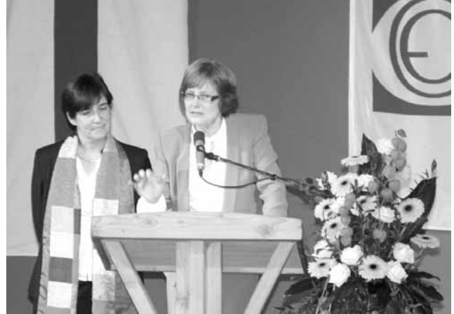
Die neue Führungsspitze am EG