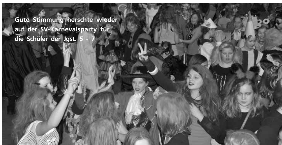
Gute Stimmung herrschte wieder auf der SV-Karnevalsparty für die Schüler der Jgst. 5 - 7

Bei weiteren Fragen steht Frau Stuckenschneider unter der Telefonnummer 0 25 23 - 93 82 79 gerne zur Verfügung.