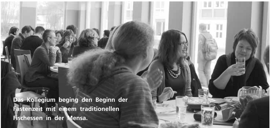
Das Kollegium beging den Beginn der Fastenzeit mit einem traditionellen Fischessen in der Mensa.