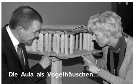
Die Aula als Vogelhäuschen...

ster, Herr Sommer, würdigte besonders die Kontaktaufnahme zu den heimischen Unternehmen und die Aufnahme des Sozialen Praktikums. Die Einführung des gebundenen Ganztags als erstes Gymnasium im Kreis Soest hob die Vertreterin der Bezirksregierung Arnsberg heraus: so gelinge die Wandlung der modernen Schule zum Lern- und Lebensraum.