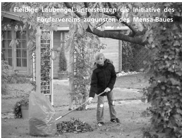
Fleißige Laubengel unterstützen die Initiative des Fördervereins zugunsten des Mensa-Baues

Tagen und an verschiedenen Stellen, u.a. dem Lippstädter Weihnachtsmarkt, von fünf Klassen Selbstgebackenes, Selbstgebasteltes und Praktisches zum Verkauf angeboten. Der Erlös betrug über 5000 Euro!