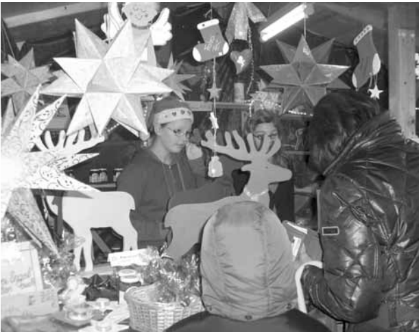
Schülerinnen der Klasse 6a im EG-Stand auf dem Weihnachtsmarkt