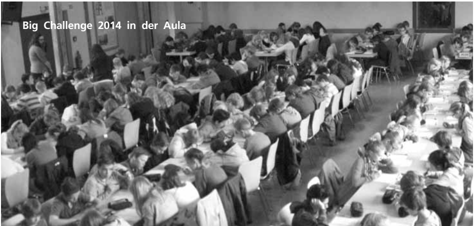
Big Challenge 2014 in der Aula

Am 12. Mai 2015 nimmt das Evangelische Gymnasium bereits zum sechsten Mal am bundesweiten Fremdsprachenwettbewerb BIG CHALLENGE teil, bei dem sich Schülerinnen und Schüler der Jahrgänge fünf bis neun einem fünfundvierzigminütigen Test mit insgesamt 54 Multiple-Choice-Fragen aus den Bereichen Grammatik, Vokabeln, Aussprache und Landeskunde stellen.